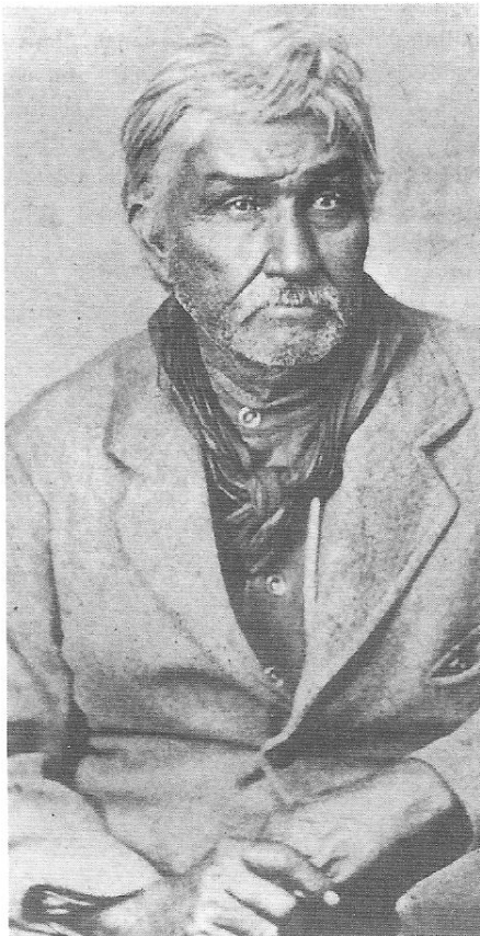
Jesse Chisholm, descubridor de la ruta que lleva su nombre.

Al final de la Guerra Civil se produjo una crisis económica en los Estados Unidos. En el Norte, las empresas que se habían dedicado a producir suministros para la guerra se quedaron sin nadie que les comprara su producción. Creció el desempleo mientras en el Sur, asolado por los ejércitos del Norte, llegaba el hambre. Muchos volvieron su vista a Texas, embarcada desde antes de la Guerra en el negocio de la cría y venta de ganado.