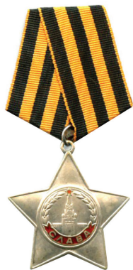
ORDEN DE LA GUERRA PATRIA