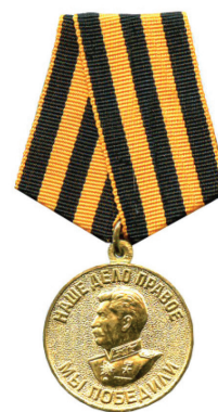
MEDALLA POR LA VICTORIA EN LA GRAN GUERRA PATRIA