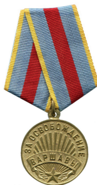
MEDALLA POR LA LIBERACIÓN DE VARSOVIA