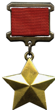
HÉROE DE LA UNIÓN SOVIÉTICA