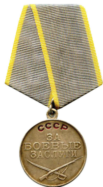
MEDALLA AL VALOR

Rodea las que has recibido y suma el total a +Medallas.