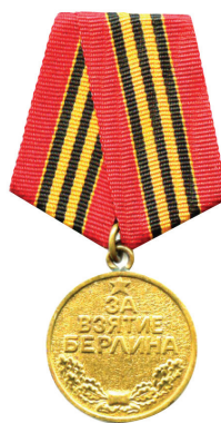
MEDALLA POR LA CAPTURA DE BERLÍN