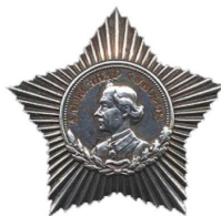
ORDEN DE LA ESTRELLA ROJA