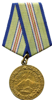
MEDALLA POR LA DEFENSA DEL CÁUCASO

No cuentan para +Medallas, pero sí para el orgullo.