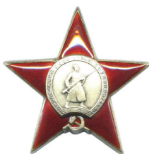
ORDEN DE LA ESTRELLA ROJA