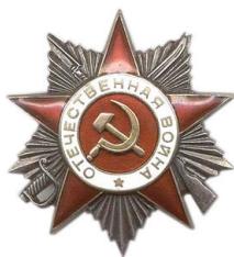
ORDEN DE LA GUERRA PATRIA