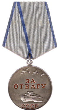
MEDALLA AL VALOR

Rodea las que has recibido y suma el total a +Medallas.