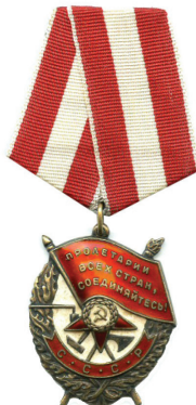
ORDEN DE LA ESTRELLA ROJA