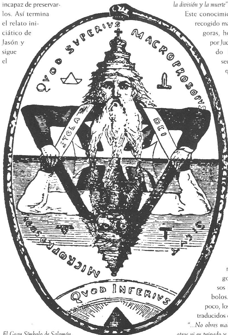
El Gran Símbolo de Salomón.

Pero para el pueblo llano, la Magia se halla asociada al trato, no con demonios, sino con ciertos "genios", de suerte que se hace distinción entre una magia buena y otra mala. En esta Magia, los "yenum" están al servicio de los magos. Estos seres que se colocan entre los dioses y los hombres serían los equivalentes a los ángeles o los demonios de la cultura cristiana.