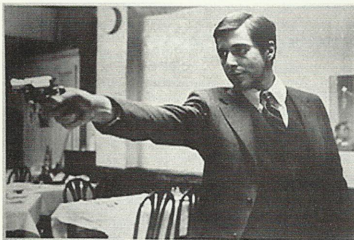
THE GODFATHER Starring Al Pacino