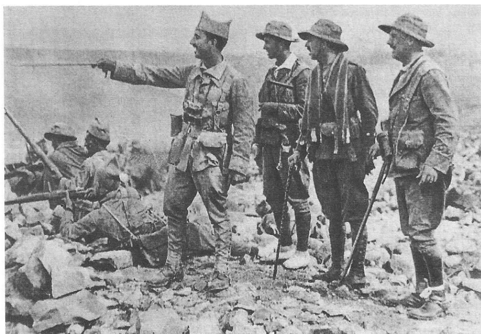
El comandante Francisco Franco dirigiendo sus tropas en África.

Sindicalista y político. Sufrió prisión varias veces por motivos políticos, siendo condenado a muerte en 1917. Se le conmutó la pena por la de cadena perpetua, siendo amnistiado más tarde para ocupar un puesto en el Concejo madrileño. De profesión yesero, ha pasado la mayor parte de su vida como funcionario de sindicato, dedicándose a hacer proyectos de obra social y negociar con la patronal de Madrid. Ha sido nombrado sucesor de Pablo Iglesias a la muerte de éste.