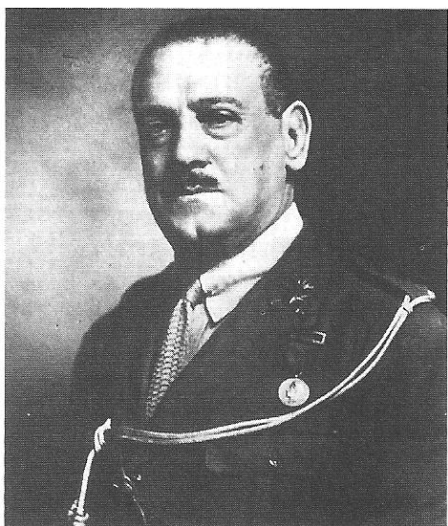
General Severiano Martínez Anido.