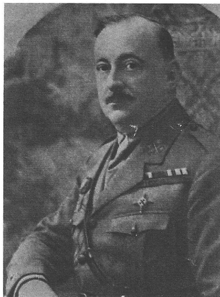
General Miguel Primo de Rivera.

Boxeador vasco. Era leñador cuando decidió marcharse a París para dedicarse al boxeo, abriéndose paso rápidamente. Pronto es campeón de España y de Europa (arrebatándole el título al italiano Spalla en 1926), combatiendo casi siempre victoriosamente tanto en Europa como en Estados Unidos. Su mejor combate se produce en La Habana, donde vence por K.O. al campeón cubano, Antolín Fierro, tras diez segundos de combate!