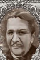
VANE, SIR ARTHUR

Heredero varón del título y de las propiedades de la noble familia Vane, hijo de sir Arthur y hermano de Eloise. Varios vecinos de Lesser-Edale sospechan que él es en realidad la bestia del condado.