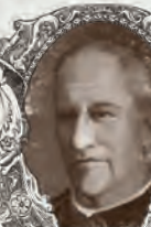
STARRET, DOCTOR HORACE

Es un experto hechicero, que lleva siglos sirviendo al mal y que ha sido enviado por Cthulhu a adquirir Los siete libros crípticos de Hsan . Actualmente reside en Shanghái, en casa de Ho Fong.