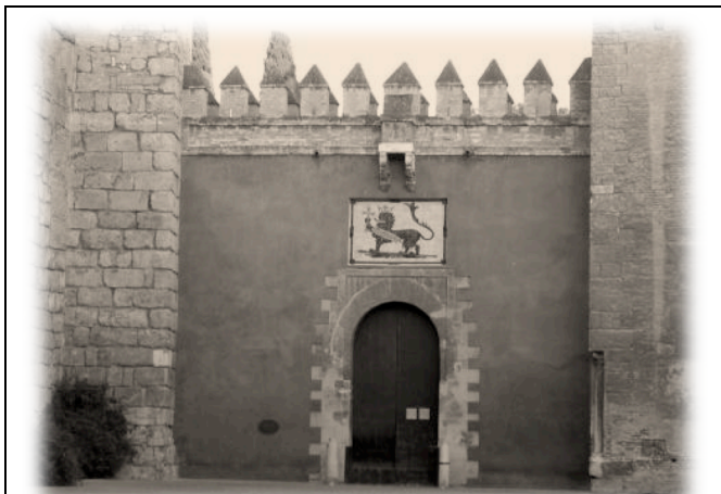
Puerta del León del Alcazar Real de Sevilla, durante esta época se la conocía como Puerta de la Montería .