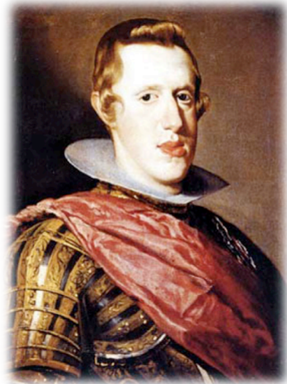
Felipe IV, retrato realizado por Velázquez en 1623 (o en 1626, según las fuentes que se consulten).

Antes de comenzar la aventura, más concretamente tras leer el segundo párrafo de “Se Dice en los Mentideros...”, pregunta a los Pjs si han estado en alguna de las recepciones, en las cercanías de los lugares sagrados donde estuvo el Rey... para saber si los Pjs vieron, aunque fuera de lejos, al monarca. Como podrás leer a lo largo de la aventura, es importante conocer estos hechos en concreto, para que no haya mucho “Metarrol”. Puedes, como Master, decir que ellos estuvieron allí y vieron a Felipe IV, de lejos, para admirar el rostro del Rey de las Españas. Como prefieras.