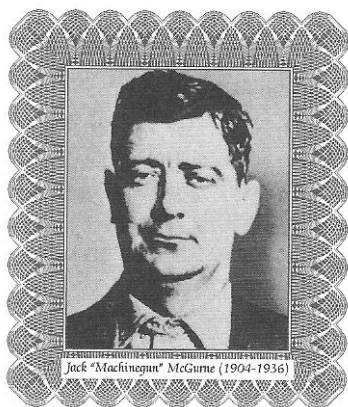
Jack "Machinegun" McGurn (1904-1936)